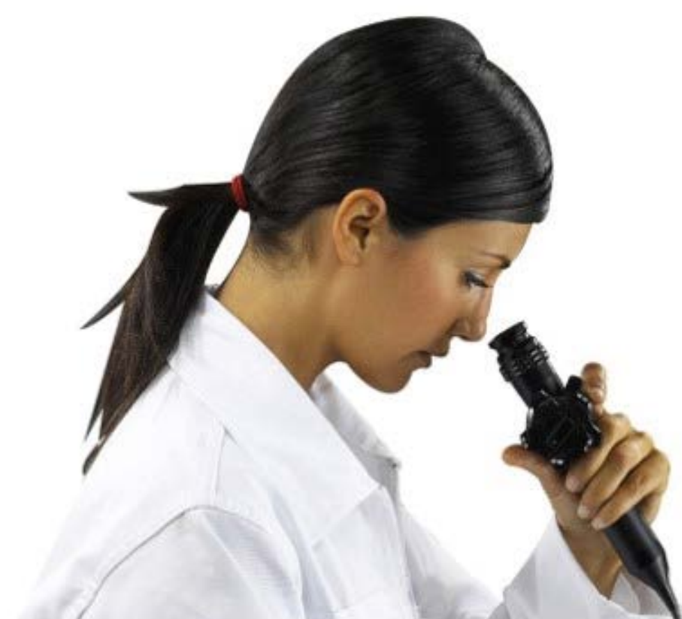
L'endoscope est l'outil le plus utilisé en inspection visuelle (EFER)