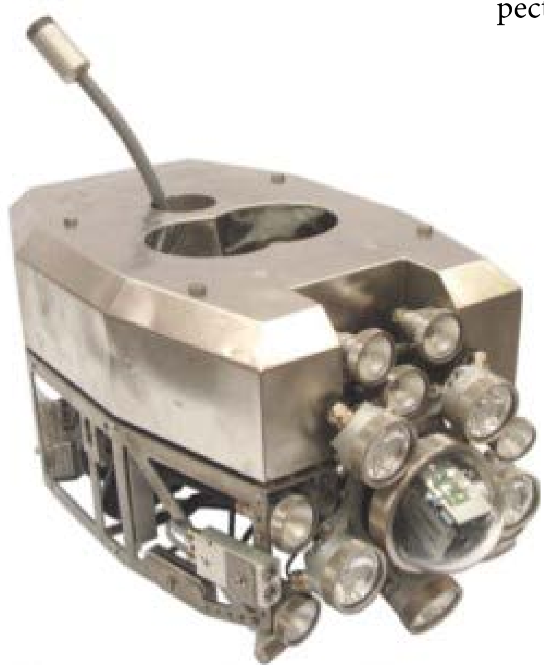
Robot autonome pour inspection visuelle (Areva Intercontrôle)