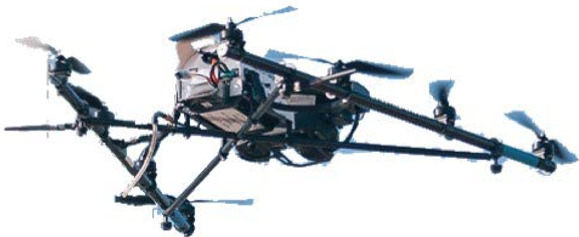
Drone équipé de caméra d'inspection (Air Marine)

CE GROUPE DE TRAVAIL VISE À DÉFINIR LES BONNES PRATIQUES DU CONTRÔLE VISUEL LORSQU'IL EST OPÉRÉ À DISTANCE, PAR CHOIX OU MANQUE D'ACCESSIBILITÉ (ENDOSCOPE, CAMÉRAS, ...)